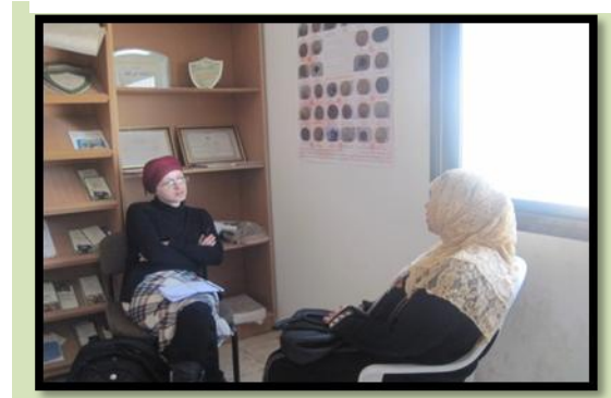
مقابلة احدى السيدات ضمن التقييم في محافظة قلقيلية