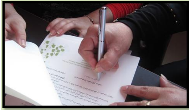
توقيع اتفاقية منحة البرنامج بين الجمعيات ومؤسسة دالية