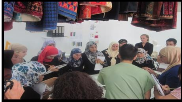
ورشة تدريب مشتركة مع المصمم الفلسطيني

وهي ايضا ضمن اتفاقية الشراكة وهي مؤسسة تعليمية تحت إشراف الوزارة الدنماركية للعلوم والإبتكار والتعليم العالي. وقد وجدت هذه المؤسسة لأكثر من 135 عام، وتتكون من مدرسة التصميم الدنماركية والأكاديمية الدنماركية الملكية للفنون الجميلة وكلية الهندسة المعمارية.