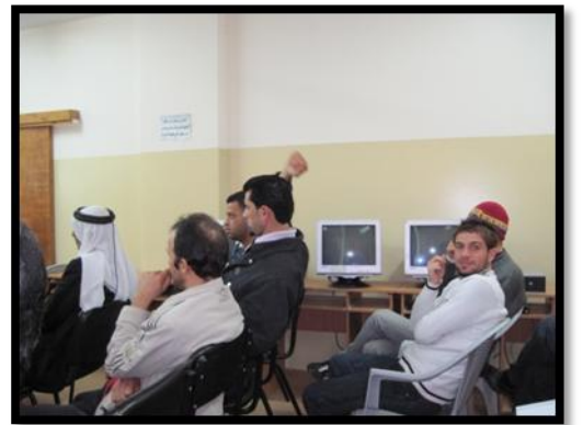
جانبا من الاجتماعات التحضيرية لاجراء الصندوق