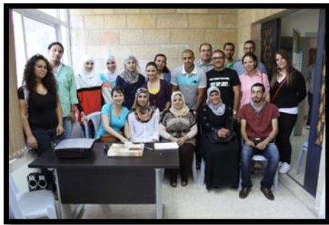
موظفي مؤسسة دالية ومجموعة المتطوعين