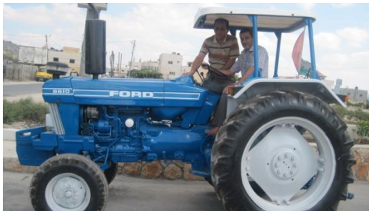
الصورة النهائية لتاهيل الجرار الزراعي بعد انتشاله من الركام