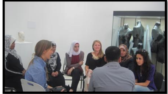
مجموعة عمل من طلاب المعهد والاكاديمية والنساء