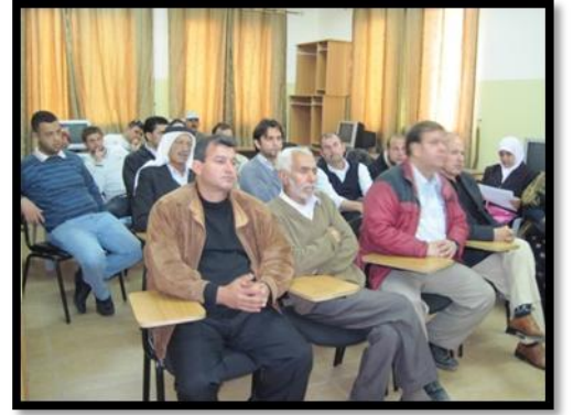
اجتماعات تشكيل اللجنة التحضيرية لصندوق الزاوية للعطاء المجتمعي