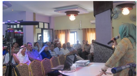
اللقاء الختامي لتقييم المشاريع وعرض التقارير