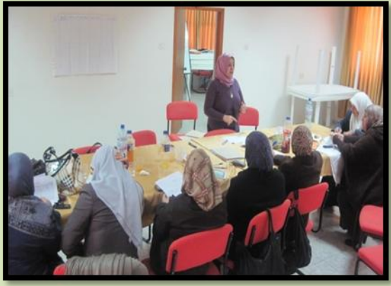
ورشة تدريب السيدات في محافظة طولكرم

انظر التفاصيل على صفحة دالية تحت منحة البرنامج للعام 2012-2013