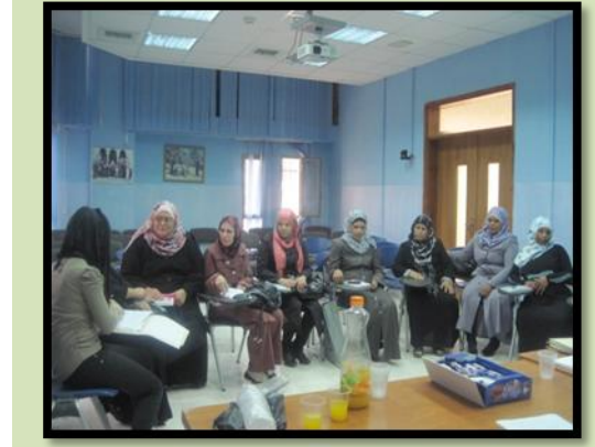
احدى لقاءات التخطيط والمتابعة في محافظة اريحا