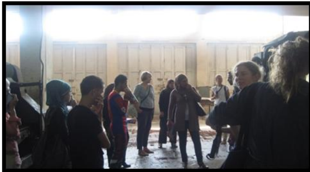
زيارة مصنع الجلود في مدينة الخليل