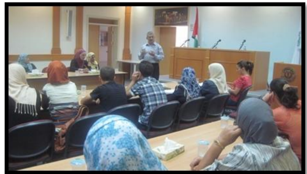
زيارة جمعية انعاش الاسرة المتخصصة بالاشغال اليدوية