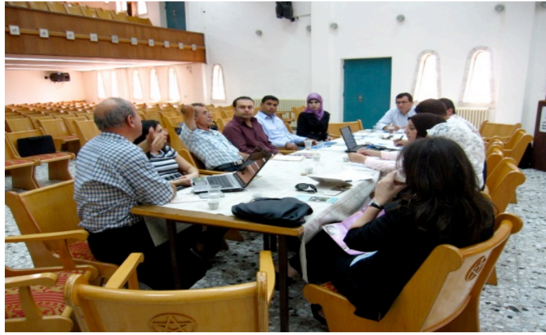
مجموعة النقاش التي مثلت بيت لحم