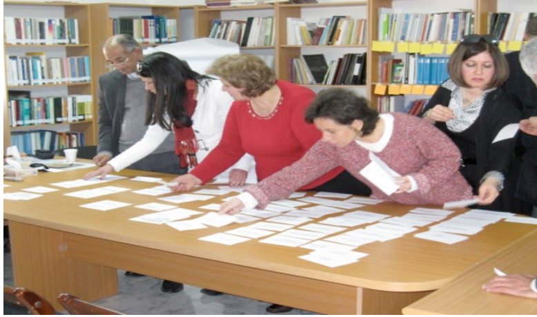
مجموعة النقاش التي مثلت مؤسسات القدس