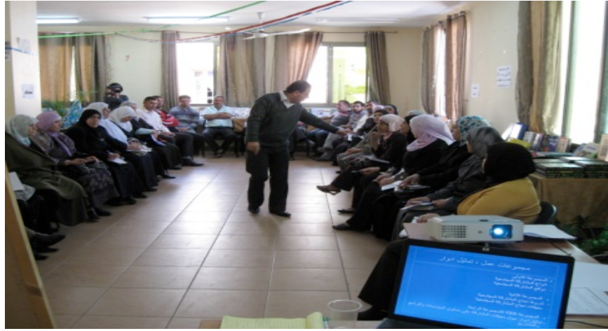
نساء قرى شمال غرب نابلس مع نساء ومؤسسات قرية الزواية في محافظة سلفيت

لذا نقوم ببناء شبكة من المؤسسات والجمعيات والمراكز والأندية التي عملنا معها واستفادت من بناء القدرات عمليا، وتبادل الخبرات والأفكار وكيفية استغلال المصادر المتاحة ، في أربعة محافظات وهي (نابلس ،الخليل ، سلفيت) ممثلة ب 50 سيدة نشيطة في العمل المجتمعي ، نقوم بربط هؤلاء السيدات مع أشخاص أو ممولين لضمان استمرارية مؤسساتهم ، حيث يتم لقاءات مشتركة بين المجموعات للتشبيك والاستفادة من الخبرات وتكثيف الجهود الجماعية فيما بينهم .